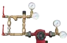
RMG p. 193